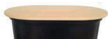
Top in legno richiudibile (optional) per convertire il trolley in desk promoter

Il coperchio è predisposto con un vano per l'alloggiamento di faretti